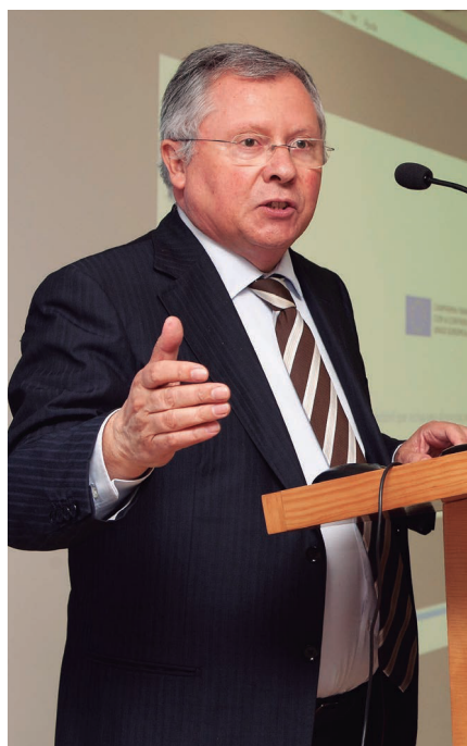
11. SECRETÁRIO DE ESTADO DA AGRICULTURA E ALIMENTAÇÃO

Marcelo Rebelo de Sousa manifestou o seu apoio a um "combate cultural" em defesa do consumo do leite, considerando que deve começar nas escolas e que representa uma causa nacional pela produção portuguesa. Referiu que pouco serve produzir, se essa produção não for acompanhada da compreensão daquilo que se produziu.