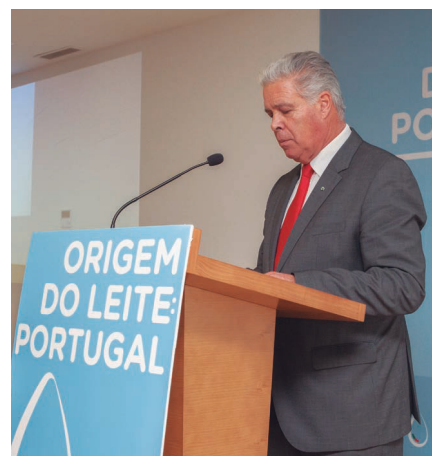
5. INTERVENÇÃO DO PRESIDENTE DA CONFAGRI

“É de destacar a importância económica e social do setor do leite a nível nacional e a sua capacidade e resiliência no sentido de se adaptar às mudanças e lutar pela sua competitividade.”