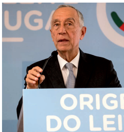
4. INTERVENÇÃO DO PRESIDENTE DA REPÚBLICA