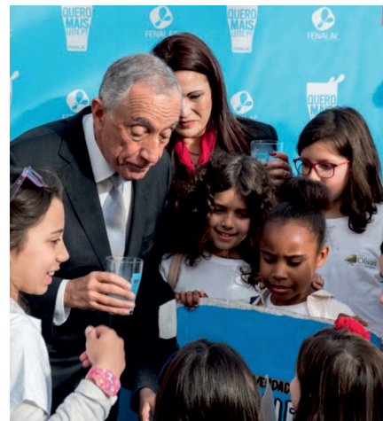
10. PRESIDENTE DA REPÚBLICA COM CRIANÇAS DA ESCOLA BÁSICA ALICE VIEIRA

de todas as atividades ligadas à mesma, reconhecendo que só quem não conhece o setor é que não tem noção da dificuldade inerente ao papel da Confederação.