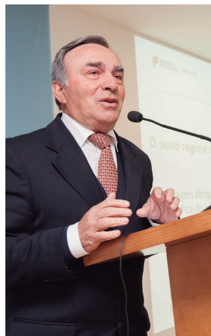
12. DIRECTOR GERAL DA DGAV

No final das intervenções, houve prova de produtos lácteos e um grupo de crianças da Escola Básica Alice Vieira cantou uma canção ao Presidente da República, que começava com a frase "o iogurte é o que a gente curte", que Marcelo Rebelo de Sousa acompanhou com palmas.