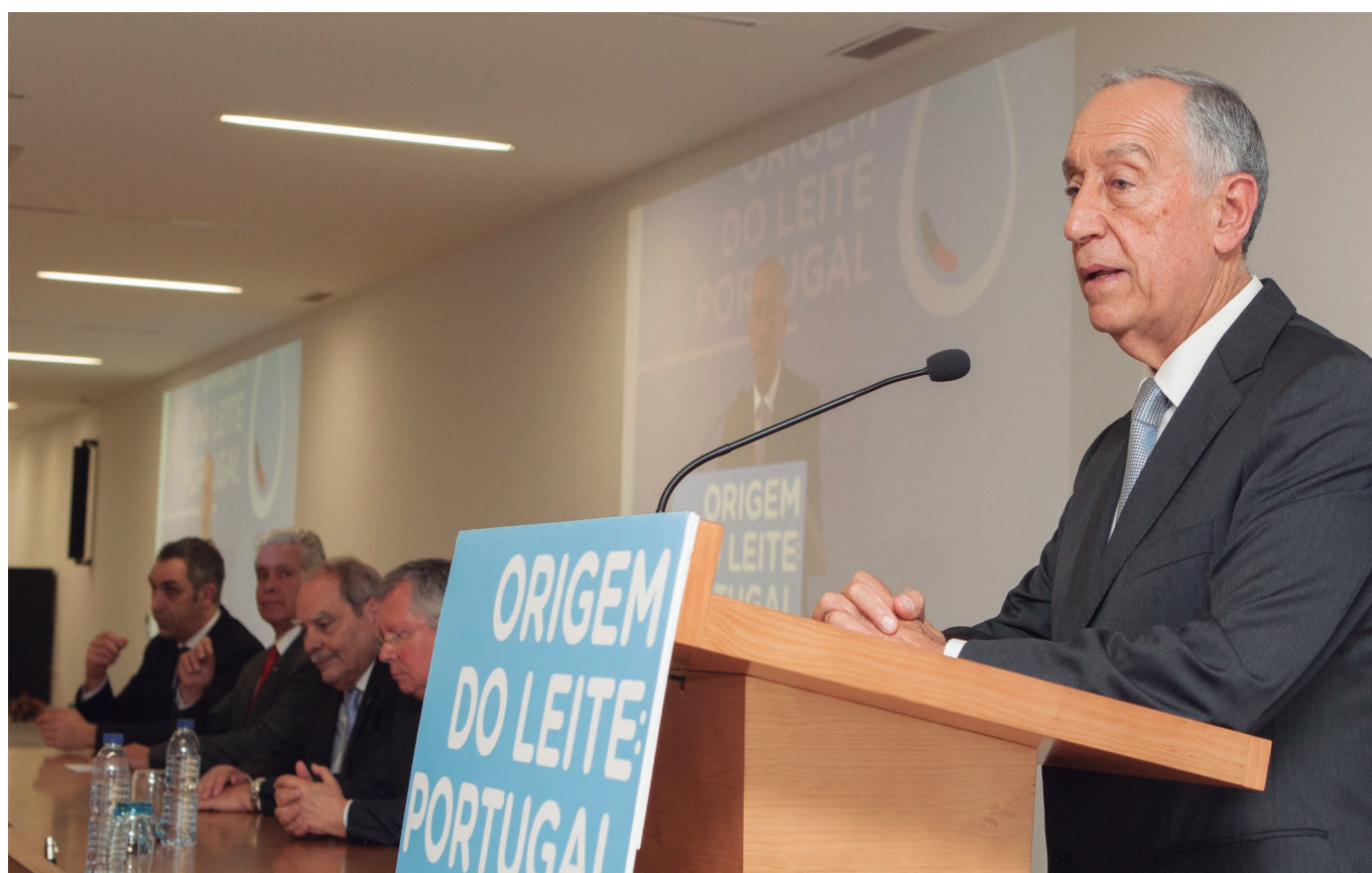
1. DISCURSO DO PRESIDENTE DA REPÚBLICA, MARCELO REBELO DE SOUSA

PRESIDENTE DA REPÚBLICA ENCERRA FÓRUM REALIZADO NA SEDE DA CONFAGRI