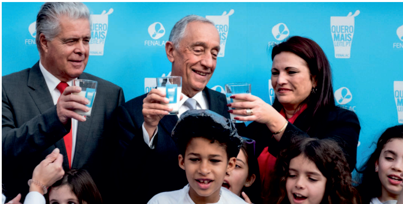
3. PROVA DE PRODUTOS LÁCTEOS COM O PRESIDENTE DA CONFAGRI, PRESIDENTE DA REPÚBLICA E PRESIDENTE DA JUNTA DE FREGUESIA DOS OLIVAIS (ESQ. > DIR.)

e interesse em conhecer a informação relativa ao país de origem dos géneros alimentícios que consomem, em particular, do leite e produtos lácteos” e defendeu a necessidade de combater alguns “preconceitos” relacionados com o consumo do leite, que assentam “em pressupostos injustificados e pouco consistentes”, realçando que “fundamentos científicos continuam a aconselhar o leite e os produtos lácteos, enquanto alimentos saudáveis de uma dieta diversificada”.