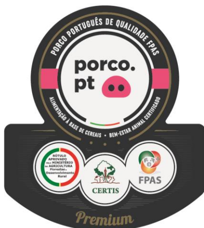
Rótulo porco.pt premium