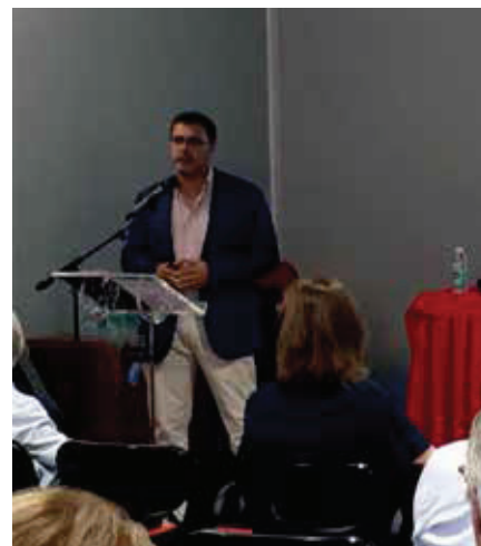
7. SEMINÁRIO DE LANÇAMENTO DA FERRAMENTA OIRA AGRICULTURA

e sobre os problemas agrícolas nacionais que os diferentes subsectores enfrentam. O evento constituiu uma excelente oportunidade de debate e esclarecimento de posições, contribuindo para a apresentação das prioridades do Programa de cada partido e para o esclarecimento de diversas questões relacionadas com o presente e o futuro da Agricultura e da Política Agrícola Comum (PAC).