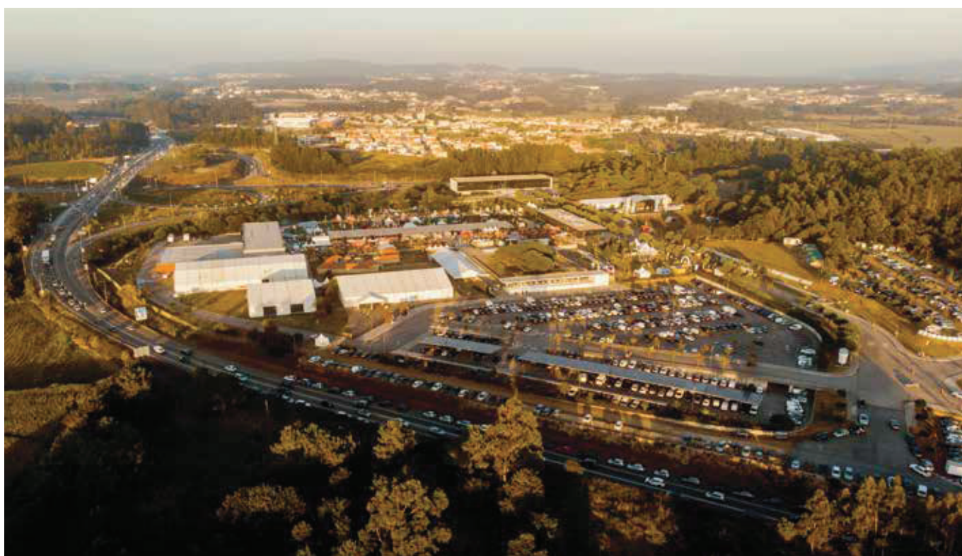
1. IMAGEM DO RECINTO DA AGROSEMANA

CONFAGRI PROMOVE DEBATE COM CANDIDATOS ÀS ELEIÇÕES LEGISLATIVAS E SEMINÁRIO DE LANÇAMENTO DA FERRAMENTA OIRA AGRICULTURA