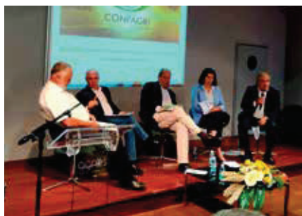
8. PAINEL DO DEBATE COM CANDIDATOS ÀS ELEIÇÕES LEGISLATIVAS

AgroSemana é de destacar que ao longo dos quatro dias do certame, marcaram presença no Espaço AGROS cerca de 200 expositores, com uma vincada vertente profissional agrícola nas áreas de negócio em exibição.