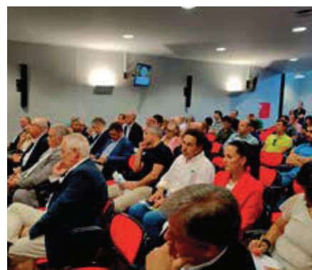
5. ASSISTÊNCIA DO DEBATE COM CANDIDATOS ÀS ELEIÇÕES LEGISLATIVAS

çamento Nacional da Ferramenta OiRA Agricultura”, uma iniciativa da autoridade para as condições do trabalho (ACT). Tendo em conta a realização das eleições legislativas, que tiveram lugar no dia 6 de outubro, a CONFAGRI, no âmbito das suas responsabilidades político-sociais e como principal organização socioeconómica da agricultura portuguesa, achou importante e oportuno promover o debate, “Perspetivas e Desafios da Agricultura Portuguesa” com o intuito de conhecer o posicionamento dos principais partidos políticos que se candidataram às eleições legislativas e desejando contribuir para o esclarecimento dos agentes do sector sobre as diferentes visões para o futuro do sector agrícola e rural. A agricultura é um dos motores de desenvolvimento nacional, contribuindo o tecido agrícola para atividades tão variadas como o abastecimento alimentar, a preservação do ambiente e do espaço rural, criando emprego e fomentando as exportações, conjugando técnicas tradicionais com tecnologia de ponta, razões que justificam a importância e pertinência desta iniciativa.