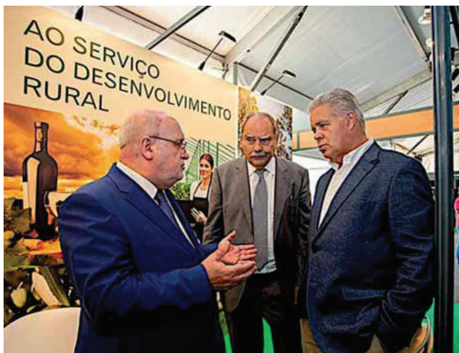
4. VISITA DO MINISTRO DA AGRICULTURA, FLORESTAS E DESENVOLVIMENTO RURAL AO STAND DA CONFAGRI