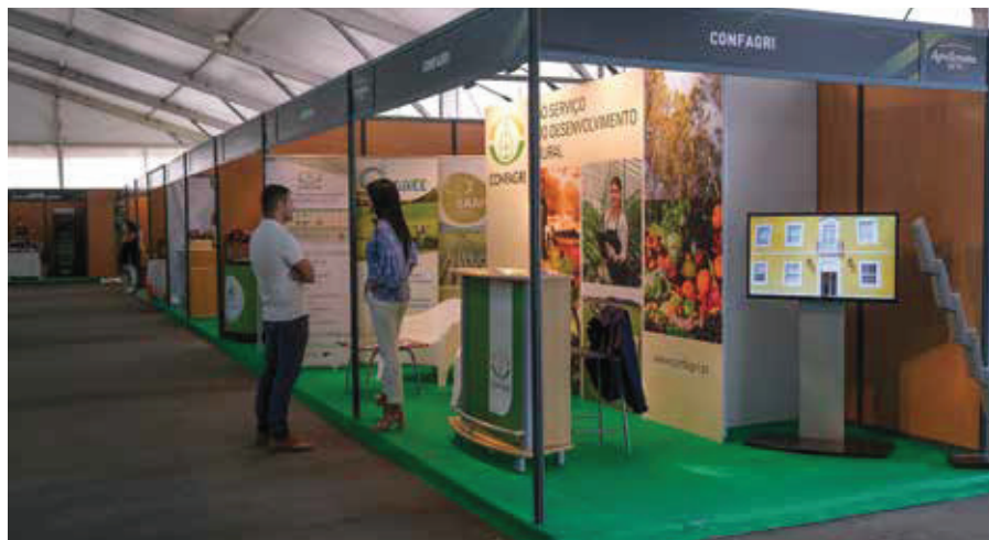
6. STAND DA CONFAGRI NA AGROSEMANA